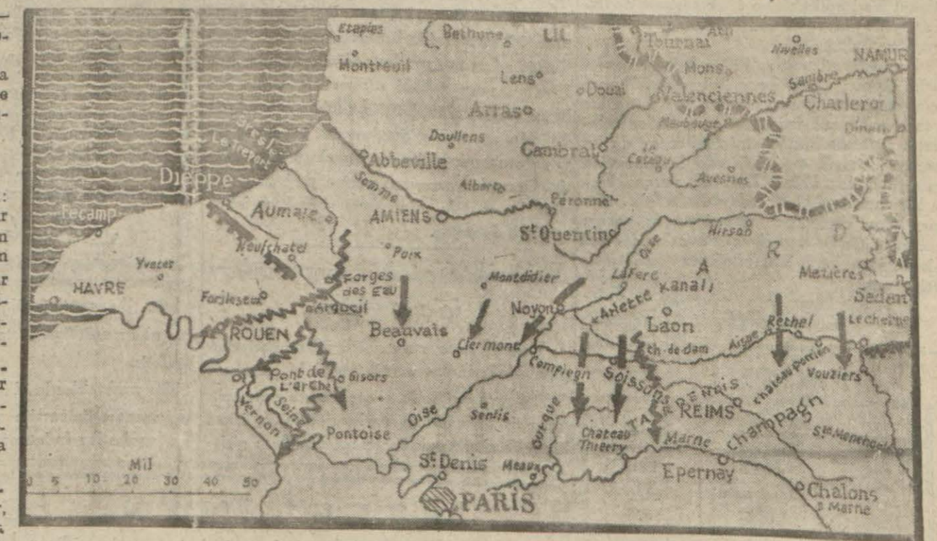
Dünkü vaziyeti gösterir kroki

Oise'in şarkında, dün öğleden sonra Soissons mintakasından ileri çıkmış olan düşman kolları, bu sabah Oureque'dan Lafertemlon, Lafere'den Tardinois'e kadar hücumlarına yeniden başlamıştır. Diğer cüzütamlar,