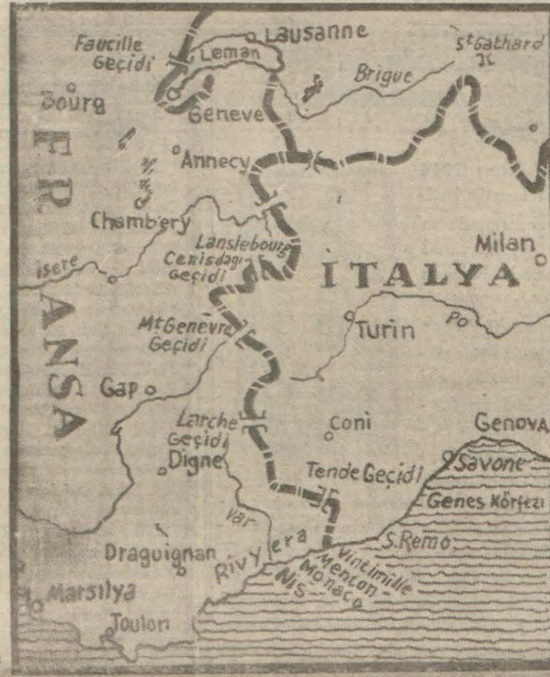
İtalya - Fransa hududunu gösterir harita

— Kara, deniz ve hava muharibleri, inkılâbın ve lejyonun kara gömleklileri, İtalyanın, imparatorluğur ve Arnavudluk kraliyetinin kadın ve erkekleri: Mukadderatın tesbit etmiş olduğu saat vatanımızın semalarında çalıyor. Cerhi imkânsız kararların saati- (Devamı 3 üncü sayfa)